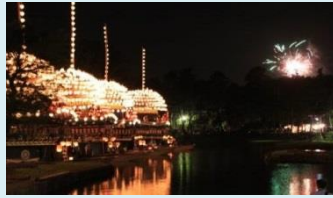
毎年7月の第4土曜日、日曜日に行われ、平成28年12月1日にはユネスコ無形文化遺産に登録された、尾張津島天王祭の車楽舟行事。【左:宵祭 右:朝祭】