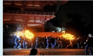
日本一のたいまつを背負い、津島神社の門を駆け抜ける開扉祭