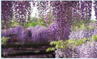
全国“藤まつり” インターネット投票 2位