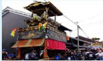
全ての山車にからくり人形を搭載した、秋まつり