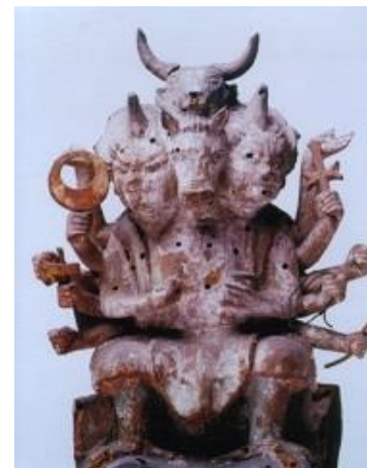
津島牛頭天王神像（興禅寺）